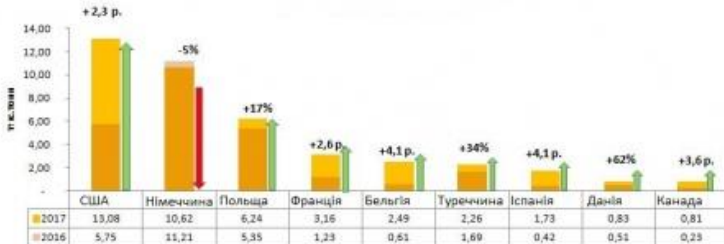
Найбільші імпортери українського меду

В цій галузі працює неймовірна кількість зайнятих людей, також бджільництво має велике значення для запилення сільськогосподарських культур та підвищення рівня їх врожайності, а це суттєвий внесок в економіку нашої держави. Бджільництво в Україні є експортоорієнтованою галуззю економіки, наша держава стабільно входить у першу п'ятірку постачальників меду в світі.